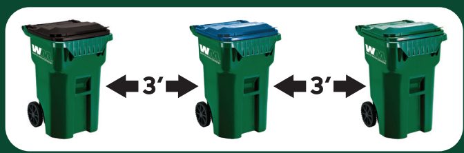
Trash Recyclables Yard Waste

Please note: Trash lids could be black or gray.